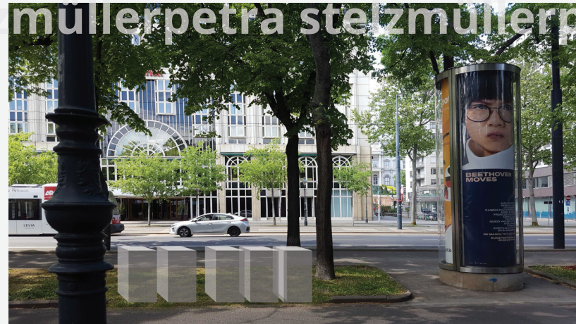
am Ring nebst Stadtpark